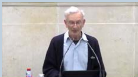
PIERRE CREPEL « Condorcet et les progrès de l'esprit humain »