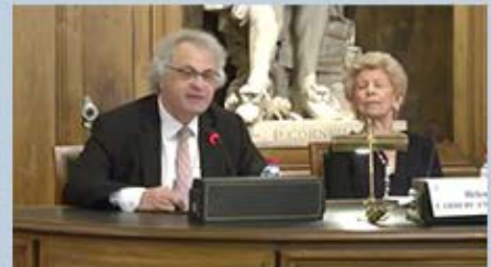
AMIN MAALOUF « Claude Bernard, quelques mots sur l'homme »