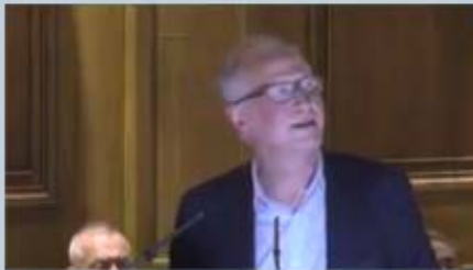
ALAIN FISCHER « Claude Bernard, une pensée d'actualité »